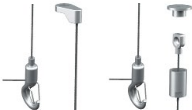
WIREKIT - KLASSISK

Vi har tagit fram två nya wirekit som är idealiska vid montage av Rockfon öar och bafflar.