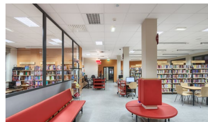
08 Inwestycje w oświacie