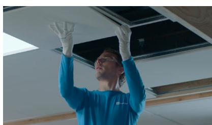
20 Nasze usługi