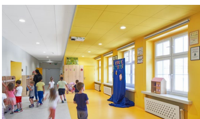
10 Subwencja oświatowa