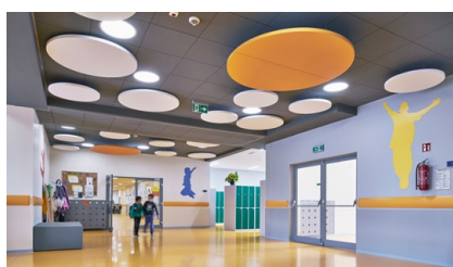
17 Współpraca z przedsiębiorcami