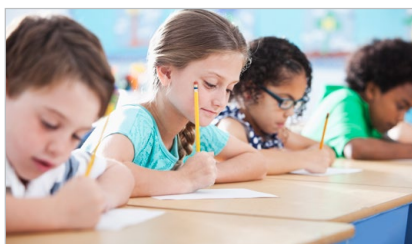
07 Jak możemy pomóc?