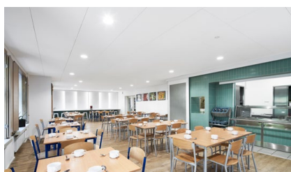
09 Posiłek w szkole i w domu