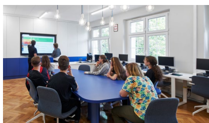
12 Fundusze Regionalne