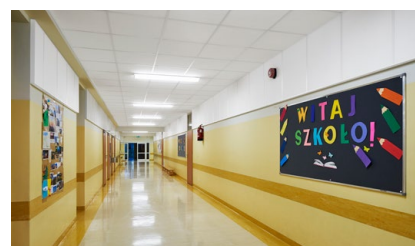
11 Fundusze Unijne na edukację