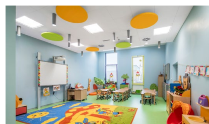
19 Szkolna zbiórka