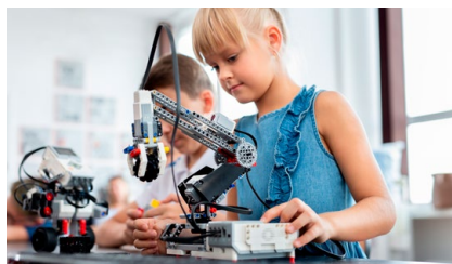
05 Akustyka jest ważna