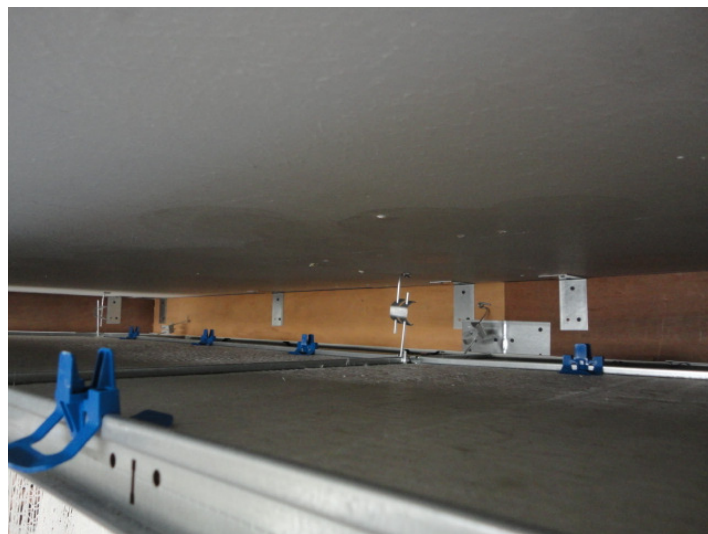
Abbildung 4: Ansicht der Unterkonstruktion