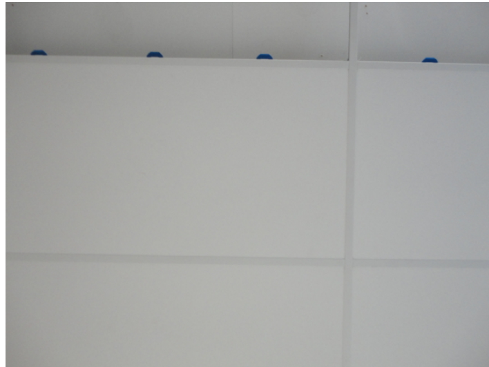
Abbildung 3: Ansicht des Deckensystems